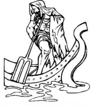
Barquero de la laguna Estigia.