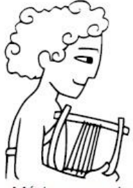
Músico y poeta que tocaba su lira.