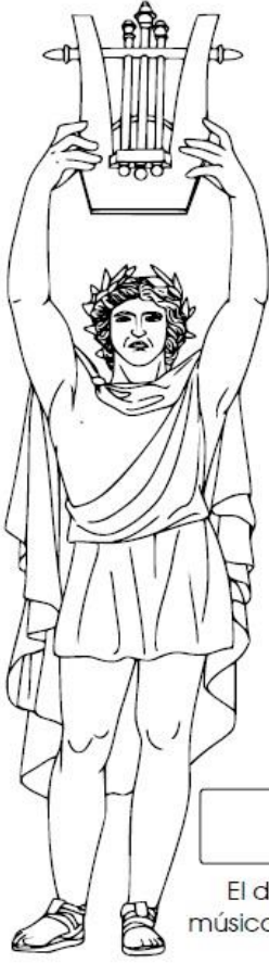
El dios de la música y las artes.

1. Escribe el nombre de cada personaje del mito de Orfeo y Eurídice. Colorea al terminar.