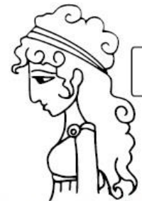
Murió por una mordedura de serpiente.